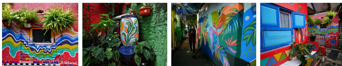
Gambar 2. Karakter ruang Kampung Cibunut Kota Bandung yang asri dan penuh warna

Berbeda dengan permukiman-permukiman padat pada umumnya, Kampung Cibunut RW 07 Kota Bandung ini terlihat lebih asri, meskipun lahan terbuka sedikit, gang juga tidak terlalu besar dan teras-teras rumah sangat terbatas. Sekilas dapat dilihat bahwa kampung ini tampil dengan penuh warna dan sangat segar.