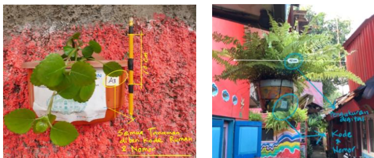
Gambar 4. Cara pengukuran dan pencatatan