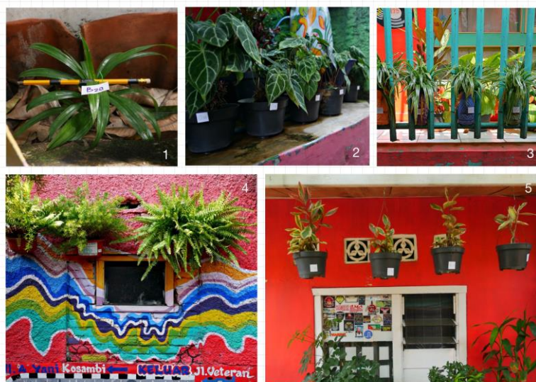
Gambar 6. Cara Peletakan Tanaman

Berdasarkan pengamatan dan penghitungan lapangan, tercatat 387 tanaman dengan cara penanaman/peletakan tanaman sebagai berikut: (1) Tanaman diletakan dalam pot di atas tanah berjumlah 251, (2) Tanaman di tempel di dinding berjumlah 72, (3) Tanaman digantung berjumlah 28, (4) Tanaman diletakan di pagar, dijepit, digantung atau ditempel berjumlah 22 (5) Tanaman di tanam langsung di tanah berjumlah 14.