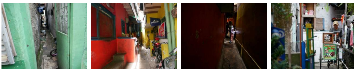
Gambar 1. Karakter ruang yang sempit di permukiman padat kota

Jadi bisa dikatakan bahwa permukiman atau perkampungan padat di kota adalah kelompok rumah yang dihuni orang berpenghasilan rendah, belum modern yang berada di perkotaan. Karakter permukiman umumnya padat, jalan atau gang sempit, sisa halaman rumah sudah sangat sedikit.