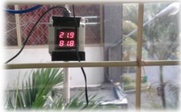
Gambar 3. Pengukuran suhu dan kelembaban

4. Pengambilan data parameter lingkungan selalu dilakukan setiap pengambilan data arus bocor untuk mengetahui pengaruhnya.