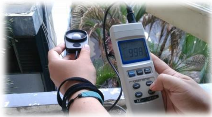
Gambar 4. Pengukuran intensitas cahaya