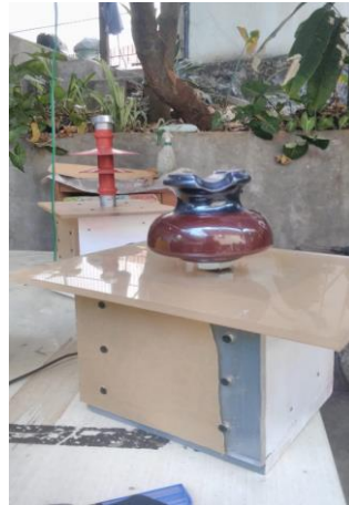
Gambar 1. Sampel isolator keramik yang digunakan