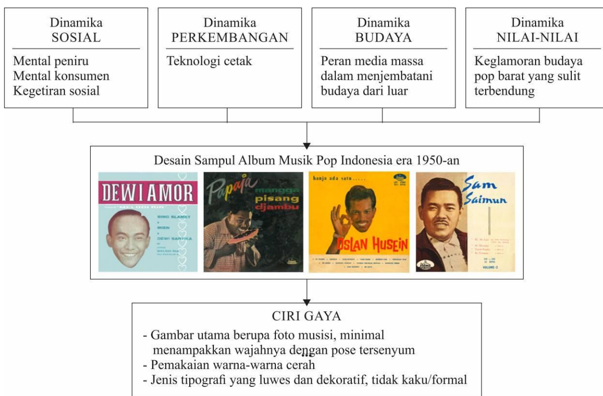
Gambar 5. Bagan tentang konsepsi gaya dalam desain yang merupakan cerminan perilaku dan sikap budaya pada waktu tertentu yang sejalan dengan dinamika kehidupan.

Perubahan-perubahan serta unsur-unsur berubah yang berpengaruh merupakan aspek utama dalam sebuah penelitian dan pengamatan sejarah desain, sehingga ke depannya dapat diproyeksikan gagasan-gagasan yang aktual berdasarkan fakta-fakta empiris yang terkumpul. Dalam penelitian kali ini, fakta-fakta empirisnya yaitu berupa sampul-sampul album piringan hitam musik pop Indonesia dan Barat. Untuk kesimpulan awal mengenai pengaruh budaya pop barat pada desain sampul album piringan hitam musik pop Indonesia era 1950an, akan distrukturkan secara sistematis lewat bagan berikut ini, yang menjelaskan bahwa konsepsi gaya dalam desain merupakan cerminan perilaku dan sikap budaya pada waktu tertentu, yang sejalan dengan dinamika kehidupan [7].