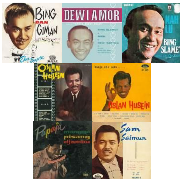
Gambar 1. Sampel penelitian dari desain sampul album piringan hitam musik pop Indonesia era 1950an (Atas - Bing Slamet, Tengah - Oslan Husein, Bawah - Adikarso dan Sam Saimun)

Industri musik merupakan ladang komoditi yang tidak akan pernah habis untuk dikaji dari berbagai macam sudut pandang. Di Indonesia sendiri industri musik mulai tumbuh semenjak Perang Dunia II berakhir, yaitu sejak era 1950an. Hal ini ditandai dengan berdirinya perusahaan rekaman lokal pertama, yaitu Irama, pada tahun 1951 di Jakarta. Perusahaan rekaman ini merekam berbagai jenis musik populer mulai dari jazz, pop, keroncong, dan lain-lain. Selang beberapa tahun kemudian (1954) berdiri pula dua label rekaman lainnya yaitu Mesra dan juga Remaco ( Republic Manufacturing Company ). Setahun setelahnya, pemerintah mendirikan Lokananta di Solo, perusahaan rekaman yang bertugas untuk mendokumentasikan program-program acara RRI (Radio Republik Indonesia), dan juga sempat merilis berbagai macam album rekaman musisi-musisi pop Indonesia [1]. Dengan makin berkembang pesatnya industri musik pop pada dasawarsa ini, maka sejalan pula dengan kebutuhan desain sampul album musik pop yang mulai mendapatkan porsi pada industri ini. Rancangan-rancangan sampul album musik mulai menampilkan pola visualnya. Seperti yang nampak pada beberapa contoh gambar berikut ini.