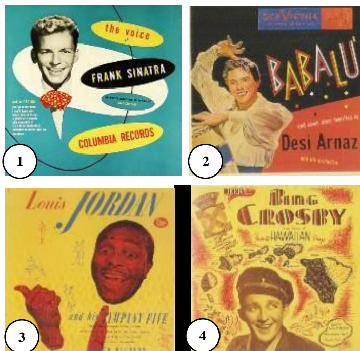
Gambar 4. Beberapa sampul album piringan hitam musik pop barat yang turut memiliki andil terhadap tren sampul album musik di Indonesia era 1950an.

1 - “The Voice Of Frank Sinatra” (Frank Sinatra). 2 - “Babalu and Seven Other Favorites” (Desi Arnaz and His Orchestra). 3 - Louis Jordan and His Tympany Five. 4 - “Favorite Hawaiian Songs” (Bing Crosby). (Sumber : buku In The Groove : Vintage Record Graphics 1940-1960 , Eric Kohler, 1999).