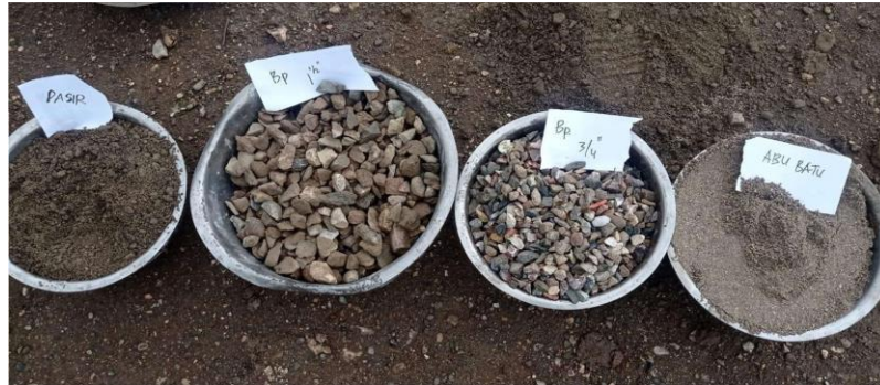
Gambar 1. Material untuk campuran beton

Gambar 1 menunjukkan material yang digunakan untuk campuran beton.