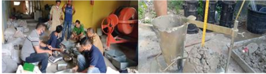
Gambar 2. (a) Proses pencampuran adonan beton dalam mixer; (b) Uji slump