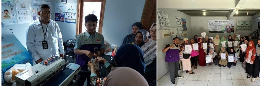
Gambar 3. Kegiatan Pelatihan dan Sertifikasi Halal

memperpanjang masa simpan produk. Dan penjelasan terkait Kriteria Jaminan Produk Halal untuk sertifikasi halal, yang mencakup pemenuhan standar halal, pengisian dokumen administrasi, serta simulasi audit halal oleh BPJPH.