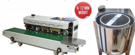
Gambar 9. Mesin Sealer dan Spinner yang Diaplikasikan pada mitra

Gambar 6 menunjukkan kondisi produk sebelum dan sesudah intervensi labeling dan sertifikasi halal. Dimana sebelumnya produk dikemas secara sederhana kemudian setelah dilakukan intervensi menjadi lebih elegan dengan kemasan yang menarik, dilengkapi klaim produk halal.