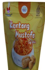
Sebelum Intervensi Setelah Intervensi