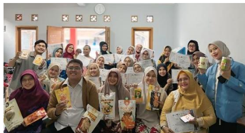
Gambar 5. Kegiatan Akhir PKM untuk Materi Bahan Tambah Pangan dan Desain Produk

Dan tahapan terakhir untuk tetap memonitoring usaha para UMKM binaan ini hingga berakhirnya program PKM tersebut.