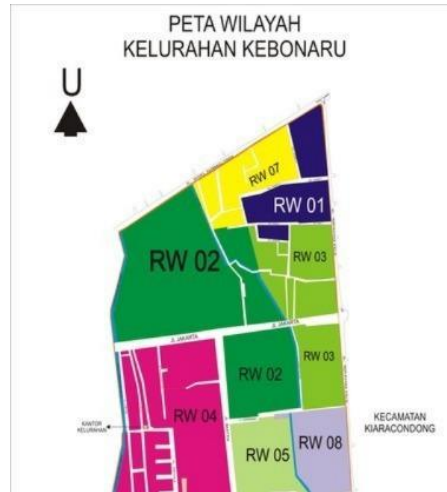
Gambar 1. Peta Lokasi PKM RW 08 Kelurahan Kebonwaru