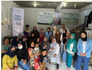
Gambar 4. Kegiatan Pendampingan dan Evaluasi

Ketiga, Pendampingan dan Evaluasi. Pendampingan akan dilakukan selama program berlangsung untuk memastikan bahwa setiap anggota komunitas dapat menerapkan teknologi dengan baik. Tim pengabdian akan memberikan pendampingan secara offline. Pada setiap tahapan dilakukan evaluasi dalam beberapa tahap, yaitu: a. Evaluasi pelaksanaan pelatihan melalui pre-test dan post-test untuk mengukur peningkatan pemahaman peserta. b. Evaluasi keberhasilan penerapan teknologi, dengan melihat efektivitas metode pengawetan dalam