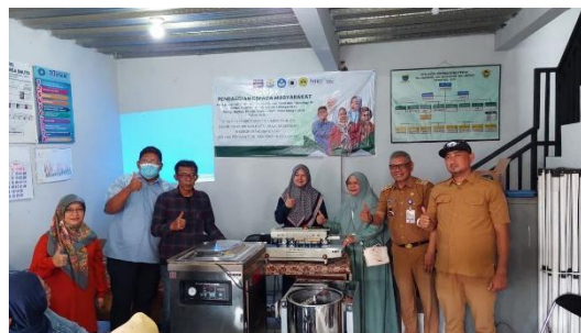
Gambar 2. Kegiatan Sosialisasi Program

Pelaksanaan PKM diawali dengan sesi diskusi rapat Tim bersama Mitra dengan komunitas Dapur Sehat untuk mengidentifikasi kebutuhan spesifik mereka terkait peningkatan daya tahan produk dan legalitas usaha. Sosialisasi akan dilakukan melalui pertemuan tatap muka dan webinar interaktif dengan menghadirkan para tim PKM sekaligus sebagai Pendamping dan Penyelia Halal serta ahli teknologi pangan dari perguruan tinggi terkait.