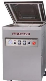
Gambar 7. Teknologi Pengemas Vakum yang Diaplikasikan pada mitra

Pada gambar 4 menunjukkan bagaimana kondisi produk sebelum intervensi produk dibungkus dengan plastik tipis dan tanpa proses oxygen absorber sehingga umur simpan tidak lama, sedangkan setelah intervensi produk menggunakan vacuum sealer dan multilayer foil sehingga umur simpan produk lebih tahan lama dan kualitasnya tetap terjaga.