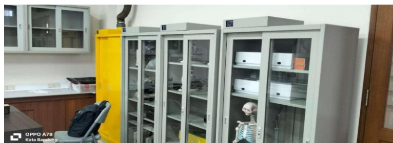
Gambar 6 Penempatan Alat Ukur Kualitas air di laboratorium Biologi SMA Al Kautsar Labschool