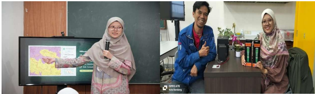
Gambar 4 Pelatihan penggunaan alat ukur kualitas air dan serah terima alat ukur ke perwakilan guru biologi SMA AlKautsar Labschool

Output: Evaluasi kurikulum dan metode pengajaran yang diterapkan.