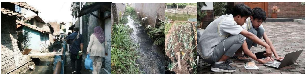
Gambar 3 Lokasi pengukuran kualitas air dan partisipasi siswa SMA Al Kautsar Labschool dalam menganalisis hasil pengukuran

Output: Tim internal siap menggunakan sistem.