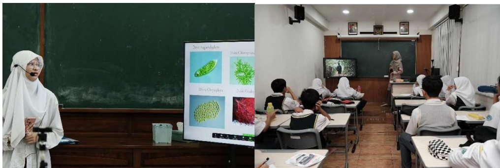
Gambar 5 Presentasi Siswa dan ujicoba pemahaman siswa SMA AlKautsar Labschool terhadap materi pelatihan yang diberikan

Output: Peningkatan kesadaran lingkungan dan kontribusi terhadap evaluasi proyek.