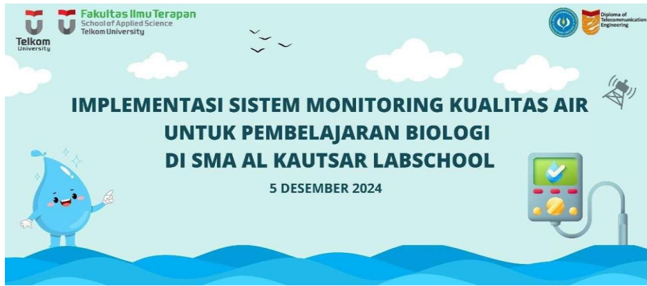
Gambar 2 Spanduk kegiatan pengabdian kepada masyarakat di SMA Al Kautsar Labschool

Bulan 2: Implementasi Teknologi dan Pelatihan