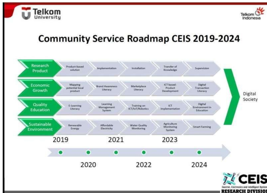
Gambar 7 Peta jalan pengabdian kepada masyarakat kelompok keahlian CEIS

Kegiatan pengabdian kepada masyarakat "Pengenalan Alat Ukur Kualitas Air untuk Pembelajaran Biologi di SMA Al Kautsar Labschool" telah dilaksanakan untuk memberikan dampak positif dalam jangka panjang, baik dalam aspek pendidikan maupun lingkungan. Potensi keberlanjutan proyek ini dan kesesuaiannya dengan peta jalan penelitian menjadi dua elemen penting yang harus dipertimbangkan untuk memastikan bahwa inisiatif ini dapat memberikan manfaat yang berkelanjutan dan relevan dengan arah perkembangan ilmu pengetahuan dan teknologi. Berikut adalah uraian mengenai potensi keberlanjutan dan kesesuaian proyek dengan peta jalan penelitian.