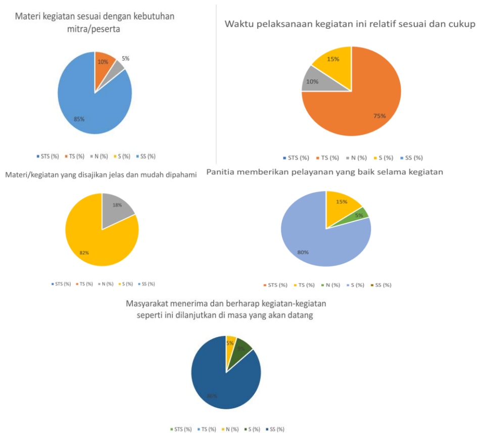
Gambar 7 Hasil survey yang dilakukan di akhir kegiatan kepada siswa/i dan guru SMA AlKautsar Labschool

Kegiatan Ekstrakurikuler: Kelompok peduli lingkungan sekolah dapat terus mendukung proyek dengan mengorganisir kegiatan terkait kualitas air dan lingkungan di luar jam pelajaran, sehingga memperluas dampak proyek.