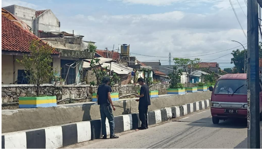
Gambar 1.2 Kondisi Dinding proses pemerataan bidang