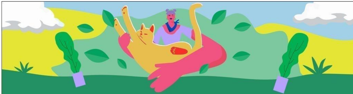
Gambar 2.7 Sketsa 2 berjudul Cintai Lingkungan