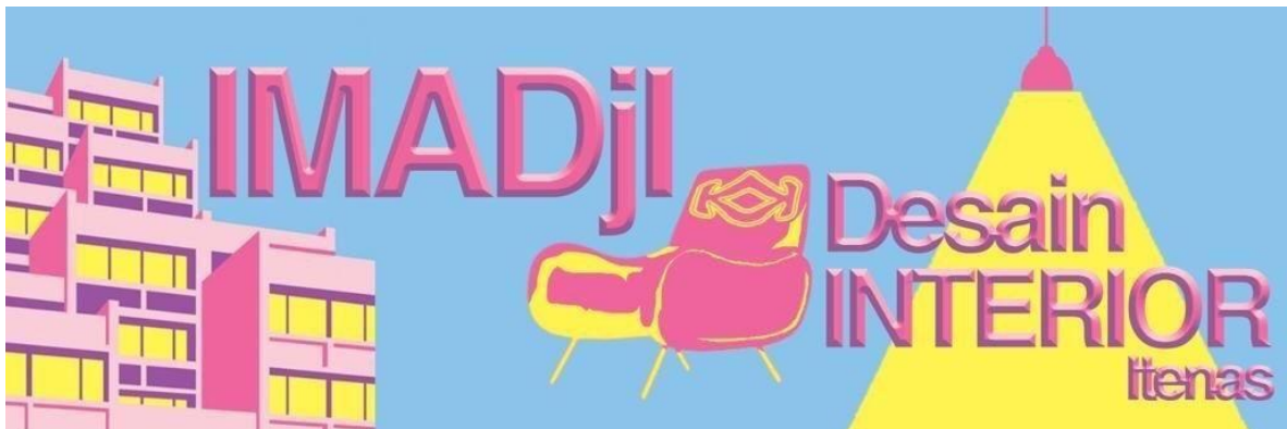
Gambar 2.7 Sketsa 3 berjudul IMADji Desain Interior ITENAS