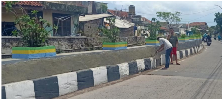
Gambar 2.4 Foto dinding sebelum di mural