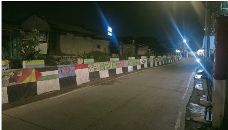
Gambar 2.5 Foto dinding setelah di mural