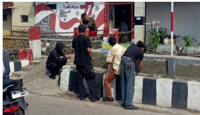
Gambar 2.2 Proses sketsa dinding tanggul Bersama warga