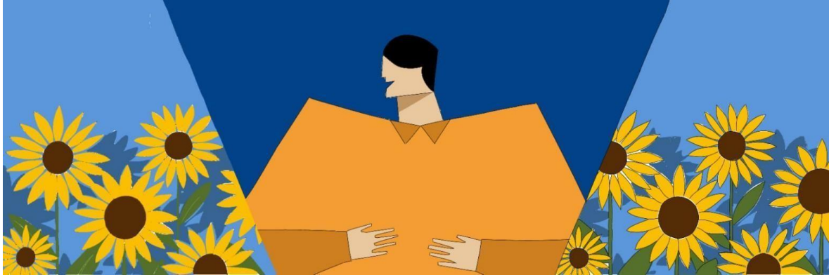
Gambar 2.6 Sketsa 1 berjudul Lingkungan Ceria