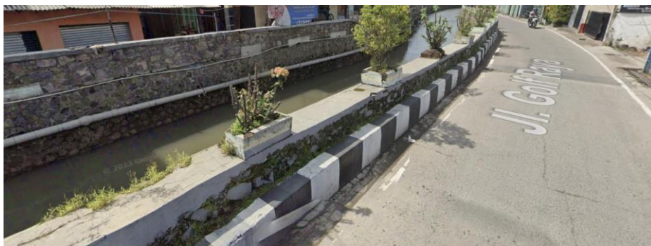
Gambar 1.1 Kondisi dinding urvey awal

Tanggul kali Cisaranten merupakan tanggul yang digunakan untuk mengendalikan aliran air sungai agar tidak memasuki area pemukiman warga. Agar menjadi tanggul yang menarik Tak ingin hanya sekedar tanggul biasa, warga menginginkan tanggul ini menjadi tanggul yang menarik dan unik selain mempercantik area sekitar tanggul, dapat berguna juga untuk menarik daya tarik masyarakat dalam maupun luar untuk menjaga kebersihan.