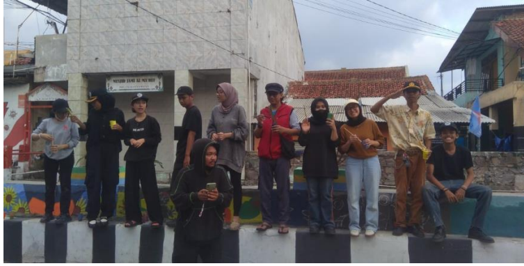
Gambar 2.3 Dokumentasi foto Bersama ditengah Tengah proses