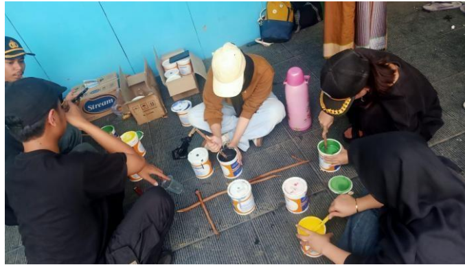
Gambar 2.1 Proses pencampuran warna Bersama warga