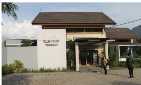
Gambar 7. Club house

Aktivitas pendukung berupa fasilitas-fasilitas pendukung kegiatan berupa pengolahan ruang terbuka luar. Baik berupa desain canopy, layout outdoor café dan sarana lain seperti sarana olah raga gocart.