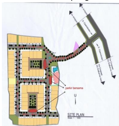
Gambar 5. Gambar sirkulasi kendaraan pada perumahan the mansion

Jalan dalam kawasan yang berfungsi sebagai jalur sirkulasi baik sirkulasi kendaraan maupun sirkulasi manusia. Pemisahan jalur antara kendaraan dan manusia memberikan ruang pemisah dengan pola material alas dan elevasi yang berbeda.