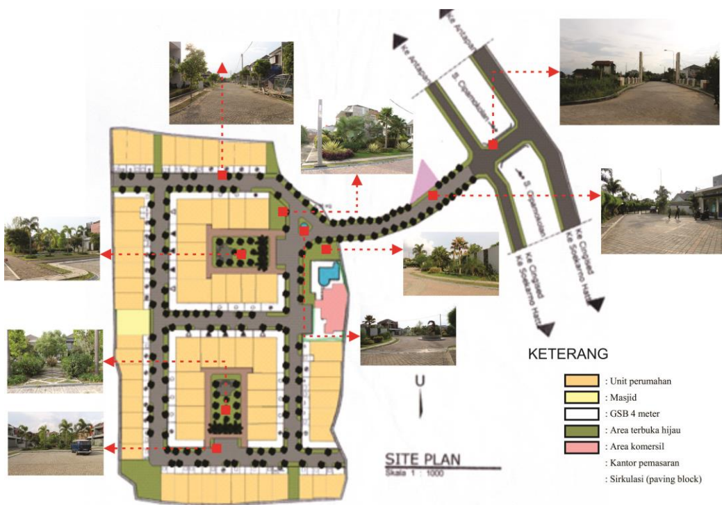
Gambar 1. Site plan perumahan the mansion

Pola site plan kompleks perumahan ini berbentuk grid, yaitu berderet secara teratur, sehingga dengan pola perletakan seperti itu orang bersirkulasi dengan nyaman. Selain dari pola site plan yang berbentuk grid luas perumahan yang relatif bisa dibilang tidak terlalu luas ini bisa meminimalisir ketidakteraturan yang menimbulkan disorientasi posisi.