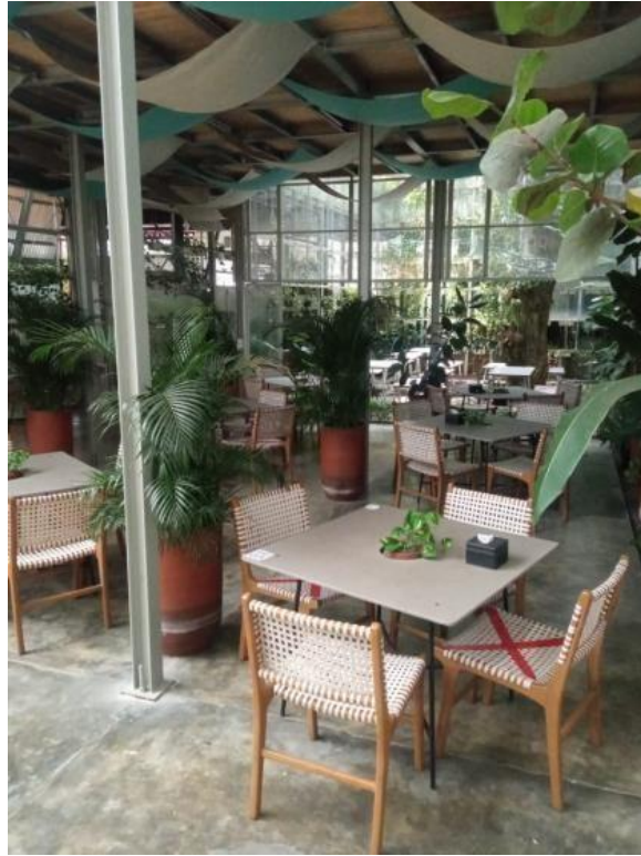
Gambar 3. Suasana ruang area makan lantai satu pada Terrassen Tea House and Eatery Yogyakarta