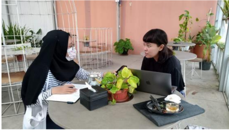
Gambar 1. Wawancara pada pengunjung Terrassen Tea House and Eatery Yogyakarta

Wawancara dilakukan secara langsung dengan menggunakan bantuan media audio rekaman sederhana yang dimiliki gadget/ handphone . Untuk menjaga keselamatan bersama, pewawancara menggunakan masker dan membatasi waktu wawancara dengan waktu lima hingga sepuluh menit.