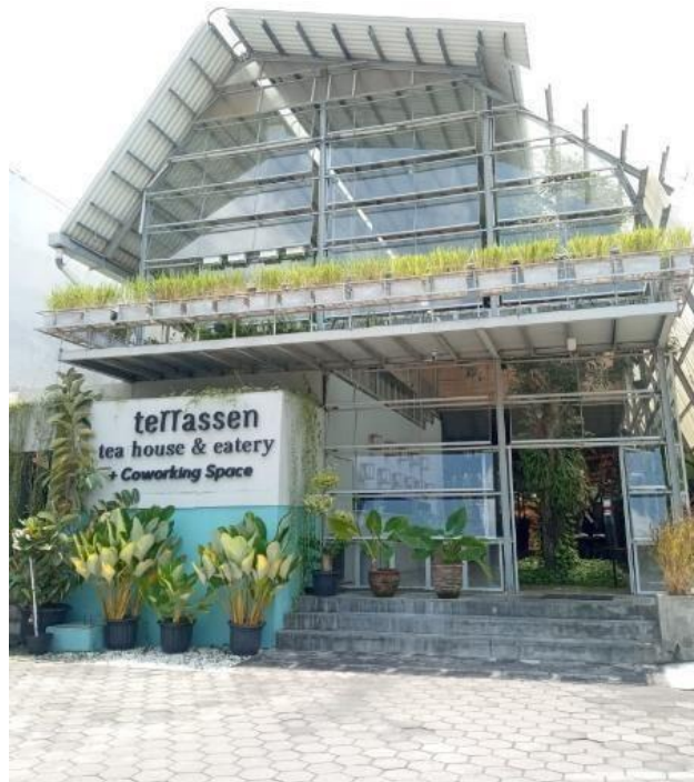
Gambar 2. Fasad pada Terrassen Tea House and Eatery Yogyakarta

Elemen warna yang menarik bagi pengunjung adalah warna hijau pada tanaman. Untuk elemen tekstur, Pihak restoran memilih untuk menggunakan tektur pada dekorasi dan furniture kayu agar memiliki kesan hangat dan alami.