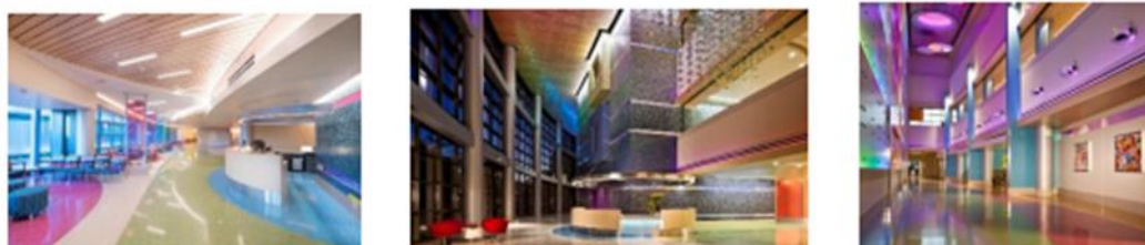
Gambar 4. Penerapan Warna Aksentuasi pada Interior Rumah Sakit Anak Phoenix Arizona

Dalam konteks interior lobby RSIA Limijati, intensitas dan proporsi warna magenta yang diterapkan dijaga pada tingkat yang mampu memberikan stimulasi visual yang menyegarkan tanpa mengorbankan kenyamanan psikologis pengguna. Pendekatan ini menghasilkan suasana ruang yang berkarakter dan hidup, namun tetap terasa aman, terkendali, dan tidak berlebihan (Fananti et al., 2021). Efek positif dari penggunaan warna aksentuasi cerah dalam proporsi yang terukur pada fasilitas kesehatan telah diverifikasi oleh berbagai studi desain evidence-based , yang menunjukkan bahwa lingkungan visual yang variatif namun terkontrol berkontribusi dalam menurunkan tingkat kejenuhan visual pengguna yang harus menunggu dalam waktu yang relatif lama di area lobby .