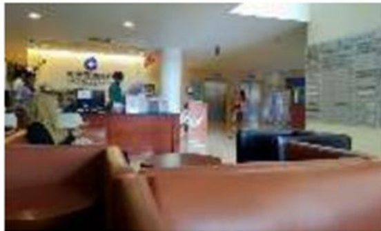
Gambar 1. Ruang tunggu RSIA Melinda Bandung

Hal ini sejalan dengan temuan pada studi komparatif interior RSIA lainnya di Indonesia, di mana warna netral terbukti menjadi strategi visual yang efektif dalam membentuk persepsi ruang yang profesional dan menenangkan.