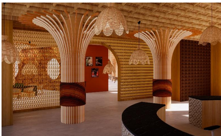
Gambar 1.3 Desain Restoran Udjo Ecoland