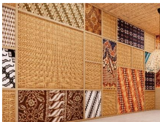
Gambar 1.5 Backdrop dengan Batik

sekaligus menjaga kelenturan alami material. Sistem pengikatan ini tidak hanya memastikan stabilitas struktur, tetapi juga mengadaptasi prinsip pengerjaan tradisional yang lazim ditemukan pada teknik ikat dan rangkai kerajinan Sunda. Dengan ritme bilah yang terbuka, kolom ini menciptakan kesan visual yang ringan dan tidak masif, sejalan dengan konsep keterbukaan ruang yang menjadi ciri utama desain Udjo Ecoland. Penggunaan accent batik pada bagian tengah kolom memperkuat identitas budaya Sunda serta menyamarkan titik pengikat struktural, menghadirkan lapisan estetis tanpa mengganggu integritas konstruksi dengan begitu, detail teknis kolom ini memperlihatkan bagaimana material lokal bambu, kayu, tali, dan batik dapat diolah menjadi elemen kontemporer yang tetap menyuarakan nilai budaya, keberlanjutan, dan kedekatan dengan alam.