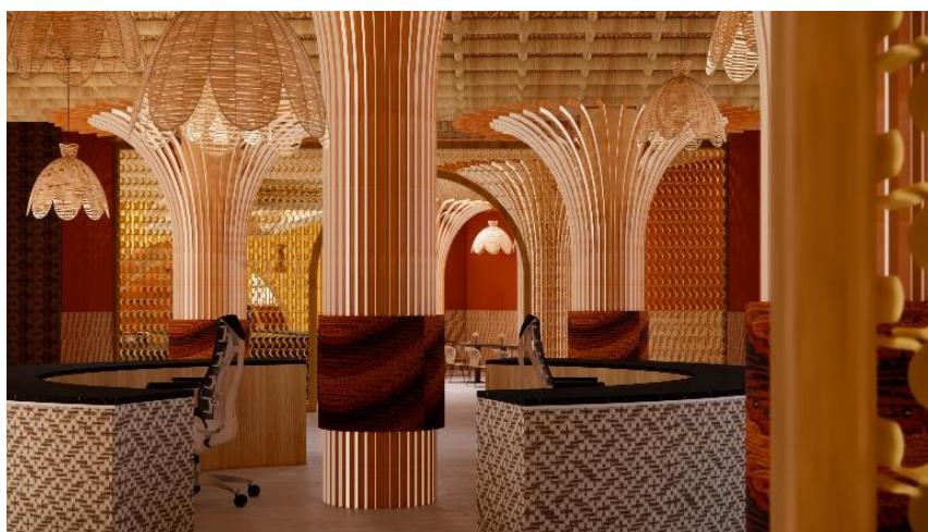
Gambar 1.2 Desain Restoran Udjo Ecoland

Anyaman rotan digunakan pada berbagai item, seperti furnitur, wall panel , dan partisi resepsionis, yang berfungsi sebagai fitur praktis sekaligus simbolis. Karakter anyaman ini memberikan ventilasi dan sirkulasi cahaya yang optimal, yang sangat penting di lingkungan restoran dataran tinggi. Selain berfungsi estetis, penggunaan anyaman rotan juga memperkuat narasi budaya di dalam ruang. Hal ini sejalan dengan pandangan (Hidayani, 2024) yang menekankan bahwa penerapan teknik anyaman tradisional dalam desain interior publik bukan sekadar dekorasi, melainkan upaya pelestarian warisan budaya yang memperkuat identitas lokal dalam konteks kontemporer. Secara simbolis juga anyaman rotan merefleksikan proses sosial dan filosofi silih asih, silih asah, silih asuh. Proses merangkai helai-helai rotan menjadi anyaman yang kuat dan indah menjadi metafora dari hubungan sosial yang erat dan saling mendukung. Visualisasi dari penerapan detail anyaman rotan yang merepresentasikan filosofi tersebut pada area resepsionis yang dapat dilihat di gambar 1.2 dan gambar 1.3.