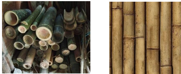
Gambar 1.6 Material Bilah Bambu

Melalui integrasi simultan antara anyaman rotan dan batik, desain interior restoran ini membentuk atmosfer spasial yang kaya akan nilai-nilai kultural, estetika, dan performatif. Strategi perancangan ini tidak hanya menegaskan identitas lokal yang otentik, tetapi juga merefleksikan prinsip inklusivitas serta fungsi edukatif yang menjadi fondasi utama konsep ruang. Ruang makan tidak sekadar menjadi tempat konsumsi kuliner, melainkan ditransformasikan menjadi media pembelajaran kontekstual, di mana pengunjung diajak untuk mengalami, memahami, dan mengapresiasi kearifan lokal Sunda yang diartikulasikan secara detail melalui elemen-elemen interior. Filosofi angklung yang berakar pada nilai-nilai kolaboratif dalam masyarakat Sunda menjadi landasan konseptual yang mendasari perancangan tata ruang interior restoran ini. Analogi orkestra angklung, di mana setiap instrumen memainkan nada unik yang saling melengkapi dalam harmoni kolektif, diaplikasikan dalam pengorganisasian ruang yang mengedepankan kesetaraan dan interaksi antar pengguna. Oleh karenanya, konfigurasi furnitur dirancang secara fleksibel dan non-hierarkis guna memfasilitasi dinamika sosial yang inklusif.