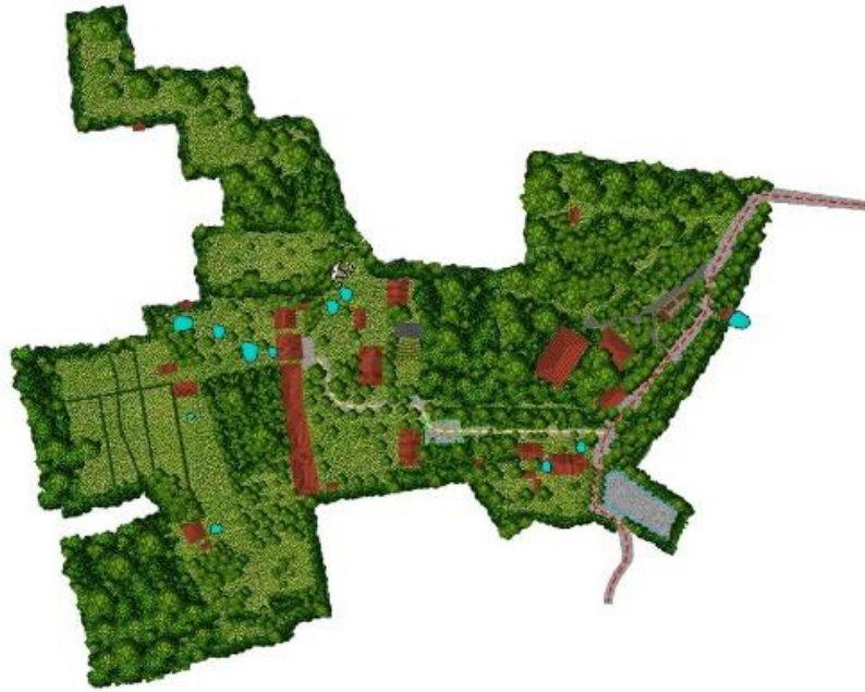
Gambar 1.1 Denah Tapak Udjo Ecoland

Konsep filosofi silih asih, silih asah, silih asuh menjadi pijakan fundamental dalam merancang tata ruang dan pengalaman yang ingin dihadirkan di restoran Udjo Ecoland. Filosofi ini menurut (Susanti, 2017) mengandung makna saling mencintai, saling mengasah, dan saling mengasuh, diterjemahkan secara nyata ke dalam desain dengan menghilangkan ruang VIP atau ruang eksklusif. Pendekatan ini menegaskan nilai kesetaraan dan inklusivitas bagi seluruh pengunjung, sehingga menciptakan suasana yang terbuka dan bersahabat tanpa batasan kelas sosial atau status. Ruang restoran dibagi secara sederhana menjadi dua zona utama, yaitu main dining dan casual dining, yang keduanya dirancang untuk memfasilitasi interaksi sosial yang harmonis dan saling berbagi pengalaman kuliner dengan kenyamanan maksimal. Penataan ruang yang fleksibel ini berfungsi sebagai medium ekspresif dalam mengartikulasikan nilai-nilai budaya yang inheren dan memperkuat identitas lokal melalui tata letak yang adaptif terhadap berbagai pola interaksi sosial.