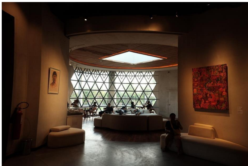
Gambar 1. Labyrinth Collective Nuanu City

Oleh karena itu, ruang dirancang tidak hanya untuk memenuhi kebutuhan praktis, tetapi juga untuk menciptakan pengalaman dan keterikatan yang lebih mendalam antara individu dengan lingkungannya.