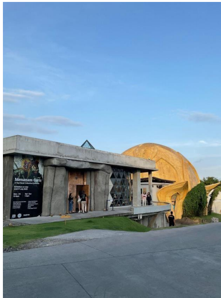
Gambar 2. Lansekap Nuanu City

Di dalam lanskap tersebut, hadir pula elemen-elemen seni publik seperti patung berdiri tegak sebagai objek utama, namun menyatu dalam narasi ruang.