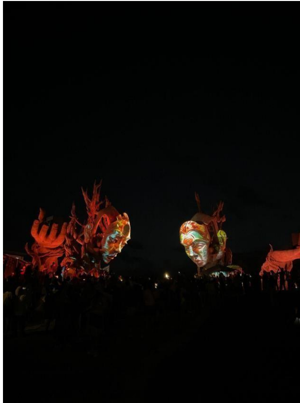
Gambar 5. Patung The Earth Sentinels